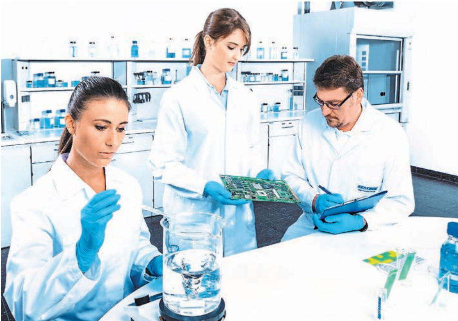
Mit größter Sorgfalt zu besten Ergebnissen