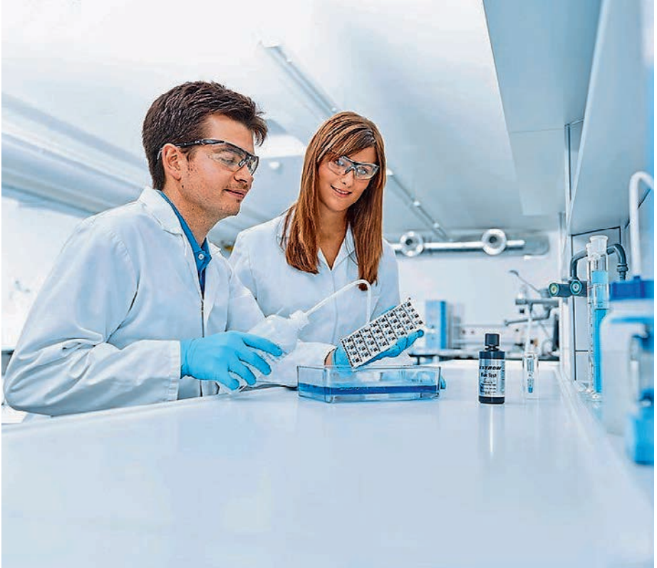
Konsequente Umsetzung der Vorgaben zur Arbeitssicherheit.

M obilität ist in jeder Altersgruppe wichtig, ob mit Fahrrad, Motorrad oder Auto. Natürlich sollten die Fahrzeuge auch in einem schönen gepflegten Zustand und der Pflegeaufwand dabei möglichst gering sein. Falsche Pflegemittel können sehr schnell zu einem großen Ärgernis werden. Umso wichtiger ist eine gute Beratung und ein Pflegemittel, das auch den Erfordernissen und der Umwelt gerecht wird. Seit über vier Jahrzehnten entwickelte sich die Dr. O.K. Wack Chemie GmbH mit verschiedenen Weltneuheiten und speziellen Problemlösungen zu einem der führenden Hersteller auf den Gebieten der Premium Pflege für KFZ- und Zweirad sowie der Präzisions-Reinigung für die High-Tech-Industrie und hat dafür bereits mehrere Auszeichnungen bekommen. Als Anerkennung für gelebte unternehmerische Verantwortung bekam die Dr. O.K. Wack Chemie GmbH den IKOM Award verliehen - eine Auszeichnung als „Zukunftsarbeitgeber 2019“. Die Verantwortung für Kunden, Mitarbeiter und Umwelt steht bei der Dr. O.K. Wack Chemie GmbH immer an erster Stelle. Dies spiegelt auch die Gründung einer Stiftung zur Glioblastom Forschung wider. Die physische und psychische Gesundheit der Mitarbeiterinnen und Mitarbeiter trägt entscheidend